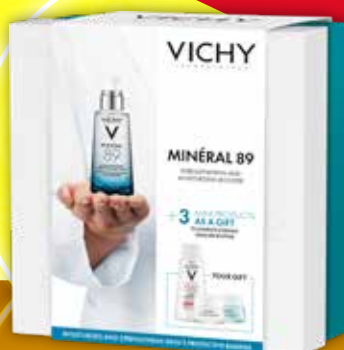
VICHY Mineral 89 Vichy sejas ādas kopšanas komplekts ar termālo ūdeni. Dāvanā 3 produktu mini versijas.