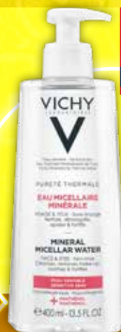
VICHY Purete Thermale Sensitive skin micerālais ūdens jutīgai ādai 400 ml