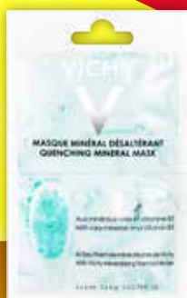
VICHY Quenching Mineral mitrinoša minerālu maska dehidratētai ādai 2 x 6 ml