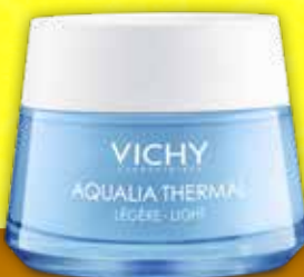
VICHY Aqualia Thermal Light mitrinošs krēms normālai un jaukta tipa ādai 50 ml