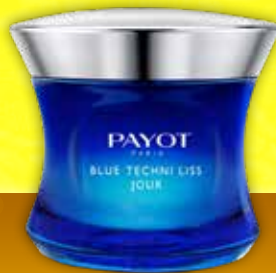
PAYOT Blue Techni Liss Jour sejas krēms gludākai, tvirtākai ādai 50 ml