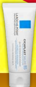
LA ROCHE-POSAY Cicaplast Baume B5 nomierinošs, dziedējošs balzams ķermenim un sejas ādai 40ml